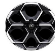
17" Alufelgen Atacamite MAX