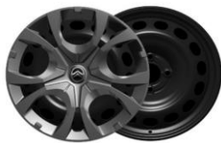
16" Radzierblende Pyrite YOU